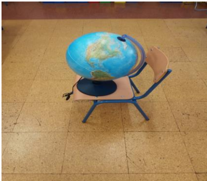
Imagen 1. La bola del mundo