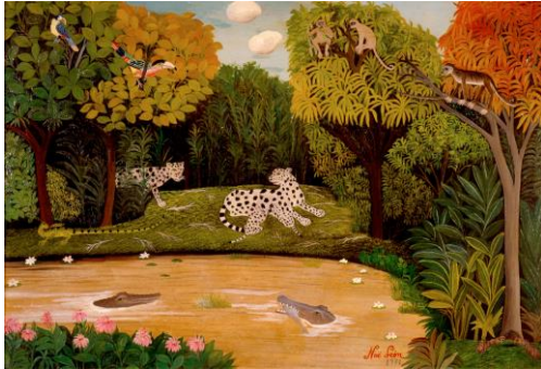
Imagen 3. Noé León