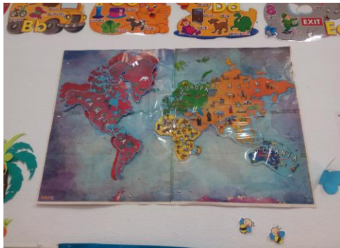
Imagen 2. Mapa mundi