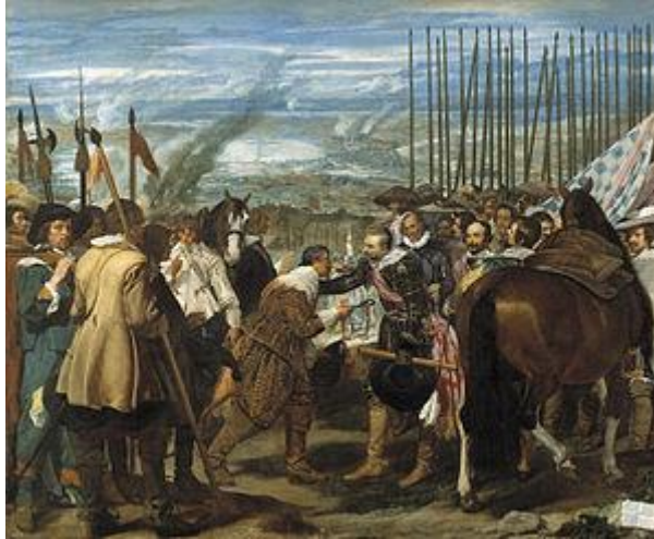
Imagen 2. Ejemplo de fuente artística. La rendición de Breda de Velázquez nos muestra el aspecto de los ejércitos del siglo XVI.