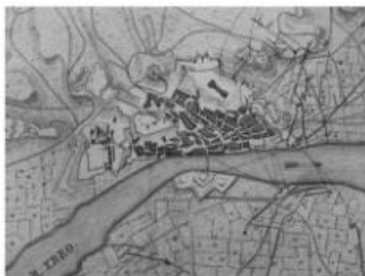
Imagen 1. Ejemplo fuente cartográfica. Grabado antiguo que muestra Tortosa a finales del siglo XIX. Fuente: 12 ideas clave. Enseñar y aprender historia.