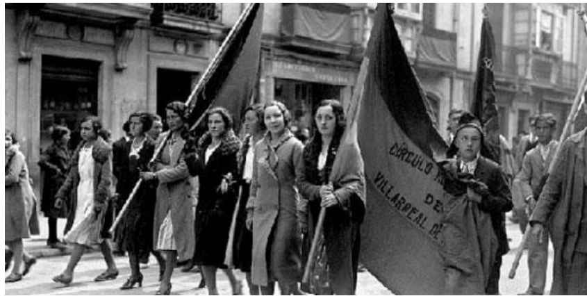
Imagen 4: Mujeres en la República.