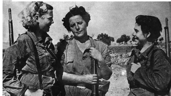
Imagen 6: Mujeres en la guerra civil.