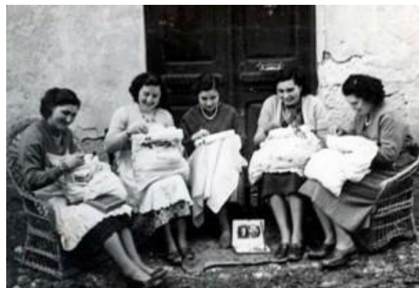
Imagen 8: Mujeres realizando labores.