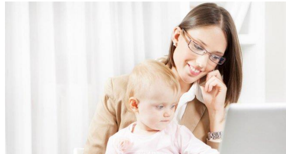
Imagen 7: Mujer hoy en día. Fuente:

http://ieg.ua.es/es/otras-actividades/exposiciones.html