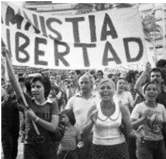
Imagen 5: Mujeres en la Transición.