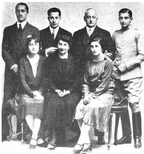
Imagen 9: Fotografía de una familia en la Dictadura de Primo de Rivera. Fuente:

http://jadoncel.blogspot.com.es/2011/10/la-guerra-civil-en-imagenes-la_16.html