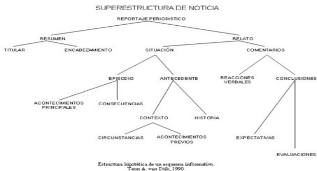
Figura 3: Superestructura hipotética de un esquema informativo. Teun A. van Dijk, 1990.

La categoría de la evaluación, como bien indica el término, suele presentar creencias y opiniones evaluativas concernientes a los acontecimientos principales que se han expuesto anteriormente en el discurso periodístico. Por otro lado, las expectativas contienen proposiciones que expresan posibles consecuencias como por ejemplo predicciones futuras asociadas a los acontecimientos principales de la noticia. Por último, dentro de la macroestructura temática de los comentarios, muchas veces se incluyen reacciones verbales que pertenecen a personajes representativos de instituciones oficiales del campo de la política, la iglesia, etc. Suelen aparecer hacia el final del discurso informativo y se expresan con citas directas o indirectas de declaraciones verbales de dichos personajes, indicando su nombre y rol en la sociedad. Esta esquematización de la superestructura del discurso periodístico se refleja claramente en el siguiente esquema propuesto por van Dijk (1990: 86):