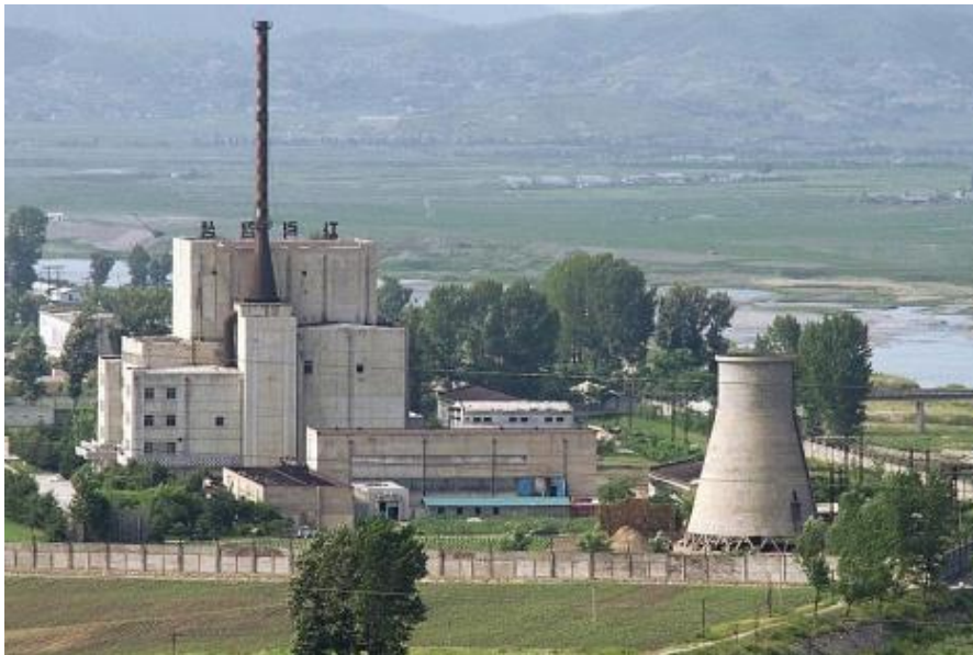
‘Central Nuclear de Yeongbyon’.

A partir de este momento se va a iniciar un periodo marcado por una constante fluctuación en la Comunidad Internacional, por un lado se creó el Tratado de No Proliferación Nuclear en la búsqueda de la paz a fin de evitar una guerra nuclear, por otro lado las constantes violaciones del Tratado que Corea del Norte va a efectuar han supuesto una períodos tensión.