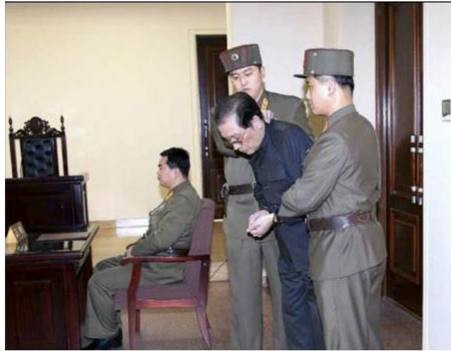
'Jang Song Thaek, tío de Kim Jong-un antes de ser ejecutado por desestabilizar el régimen'

principal causa de su ejecución ha sido la disidencia política. Este régimen está salpicado constantemente con ejecuciones, y toda una serie de violaciones de los derechos humanos.