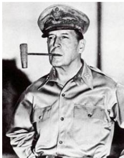
"El General Douglas Mc Arthur, recibió el mando de las tropas de la ONU en la Guerra de Corea".

Ante la invasión la respuesta estadounidense fue inmediata. El país norteamericano pidió la convocatoria del consejo de seguridad de la ONU para reaccionar ante esta invasión. Al mando de la operación se encontraba el general Mc Arthur, cuyo ejército estaba formado por una coalición de tropas multinacionales. Estas desembarcaron en el puerto de Inchon y poco más tarde el ejército encabezado por el militar norteamericano derrotó al ejército del norte hasta llegar a la capital Pyongyang el 19 de octubre de 1950.