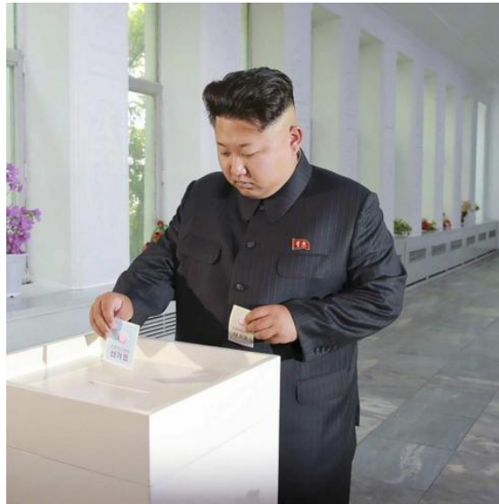
"El líder, Kim Jong-un acude a votar en las elecciones municipales".

Como vemos lo que evidencian este tipo de elecciones, es la cara oculta que se esconde tras la máscara de un nombre, que no por ser profundamente democrático, revela lo que realmente sucede en la República Popular "Democrática" de Corea.