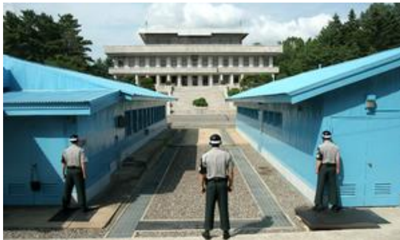
"Panmunjom, lugar en el que se firmó el armisticio intercoreano en 1953"

Este conflicto bélico supuso el primer enfrentamiento armado de la Guerra fría con numerosas pérdidas humanas (se calcularon unos 9.200.000 de muertos en total), materiales, etc. todo para que el resultado final no cambiara nada del inicial.