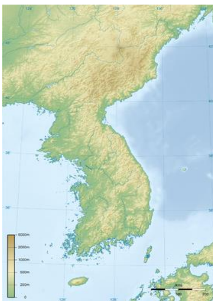
"Península de Corea".

La península de Corea se encuentra ubicada 1 en el extremo oriental del continente asiático, sus costas son bañadas; en su zona occidental por el Mar Amarillo, mientras la cara oriental la baña el mar de Japón. La península alberga políticamente en dos Estados: Corea del Norte y Corea del Sur, divididas por el paralelo 38. Físicamente la Península norcoreana limita con las siguientes regiones: en su frontera norte con China, al noreste con la región rusa de Primorsky, al sur con Corea del sur y al sureste con el archipiélago japonés, del cual está separado por el mar de Japón.