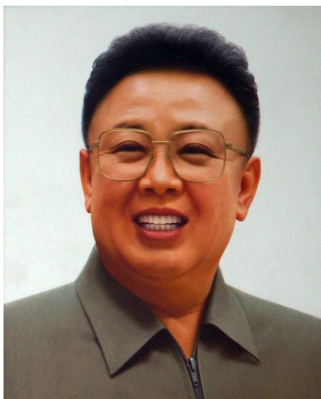
"Kim Jong Il hijo y sucesor de Kim Il Sung. "