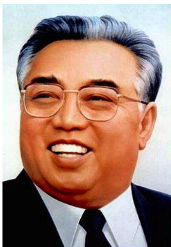
"Imagen del presidente eterno, Kim Il Sung".

Tras el conflicto civil el país quedó devastado, y se desarrollaron una serie de medidas o reformas para la reconstrucción de Corea del Norte. Durante los años de posguerra, se puso en práctica la política de Chollima, la cual fue utilizada para alentar al pueblo coreano a reconstruir el país desde sus cenizas. Una de las frases usadas que resumen perfectamente esta política es "si los demás países avanzan un paso, los norcoreanos deben avanzar diez".