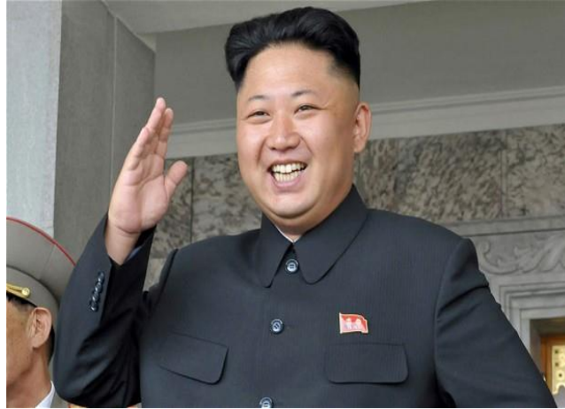
"Kim Jong-un, heredero de Kim Jong Il".

Obama actúa como un mono en una selva tropical", y entre otras muchas la creación de una "brigada de placer" que consiste en recluir a niñas de 13 a 14 años en un hotel de la capital, donde las jóvenes dependiendo de su aspecto físico servirían al régimen de una u otra forma. Con esto intento demostrar la personalidad de este tirano.