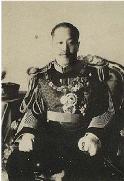
"Sunjong último rey de la dinastía Joseon"

La península de Corea fue gobernada durante varios siglos por la dinastía Joseon, desde que en 1394 el general Lee Sung-kei estableciese esta dinastía, hasta 1910 cuando el Imperio Nipón se anexionase la península y pusiera punto y final a la monarquía. Durante el siglo XIX los diferentes Estados asiáticos lucharon contra la intromisión de las potencias occidentales, al igual que la dinastía Joseon, que renunció a todo tipo de relación diplomática con estas. Su principal aliado China mantenía una política similar. En este contexto, ante la amenaza que suponían las potencias europeas, cuando China no pudo proporcionar ayuda a la monarquía coreana que permitiese plantar cara al Imperio japonés, esto supuso que la nueva potencia industrial, invadiese la península y acabase con una dinastía que había perdurado durante 516 años.